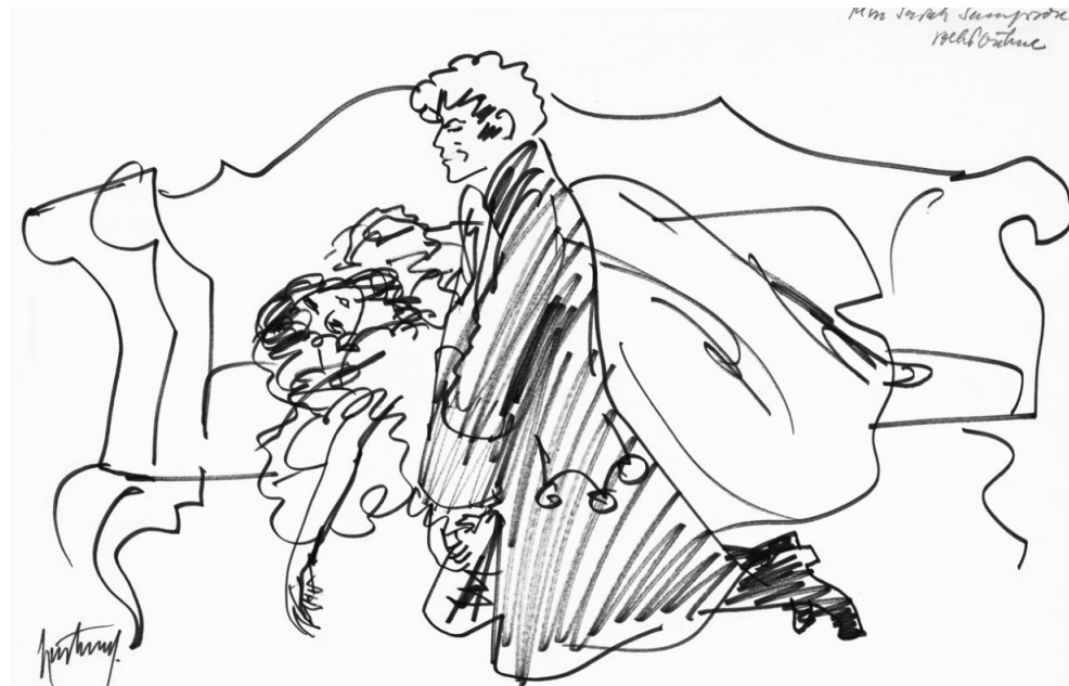
Eine Skizze von Gerd Hartung zum Szenenbild der Aufführung von „Miss Sara Sampson“ durch die Freie Volksbühne in Berlin, 1972